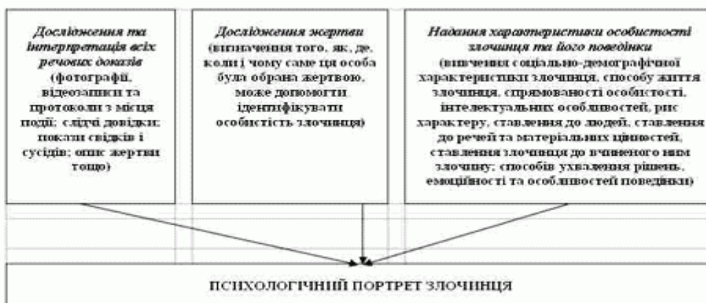
Схема 1 Структурно-логічна схема психологічного портрета злочинця

Психологічний аналіз слідів і обставин злочину в рамках методики складання психологічного портрета злочинця може ініціювати продуктивні версії про особливі ознаки злочинця, що дозволяють звужувати коло підозрюваних, а також виявляти винного серед осіб, які потрапили в поле зору слідства.